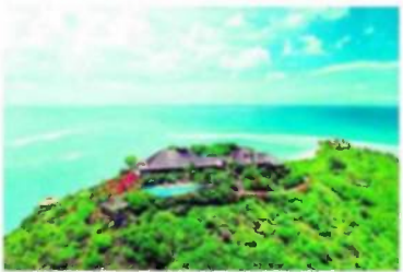
מימין: מתוך מטוס של וירג'ין, במסגרת עיתונאים לקראת פסטיבל וירג'ין 2007, עם כוכבת הפופ הדרום אפריקאית איבון צ'אקה צ'אקה ביום ההולדת ה-85 של נלסון מנדלה. הבית המפואר על האי בקריביים, לקראת הטיסה מסביב לעולם בכדור פורח ב-2007